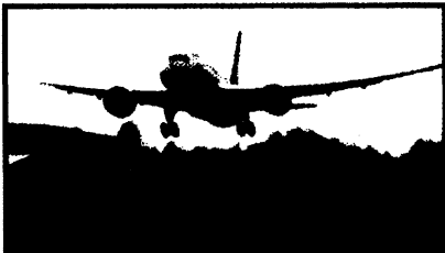
trouble (6 photos)