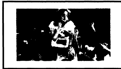
New Video in LA (10 photos)