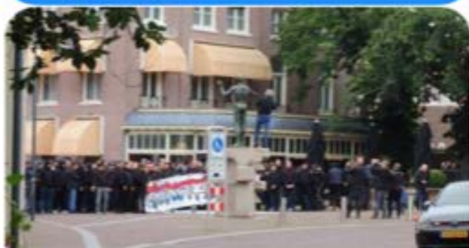
Confrontatie demonstranten en

Confrontatie demonstranten en ME op 5 Meiplein in Wageningen